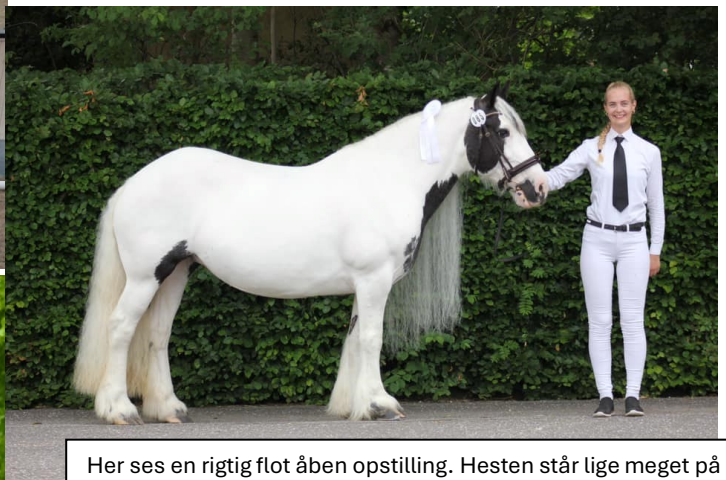
Her ses en rigtig flot åben opstilling. Hesten står lige meget på alle fire ben. Et bagben lettere bagud og et forben lettere forud.