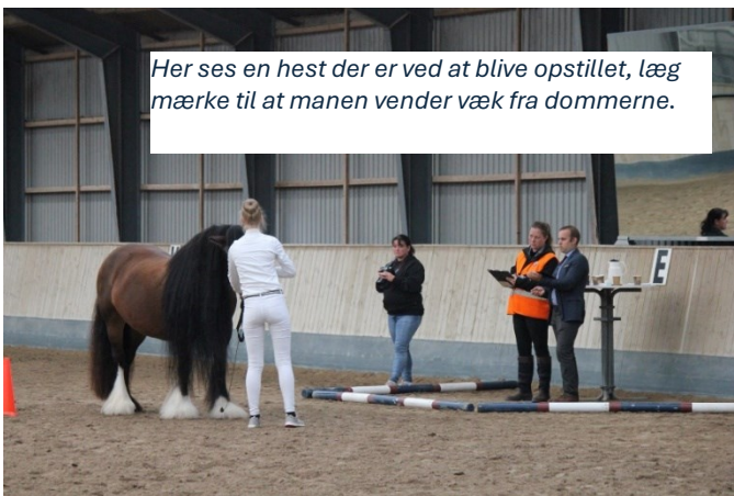
Her ses en hest der er ved at blive opstillet, læg mærke til at manen vender væk fra dommerne.