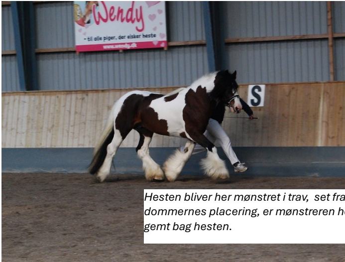
Hesten bliver her mønstret i trav, set fra dommernes placering, er mønstreren helt gemt bag hesten.