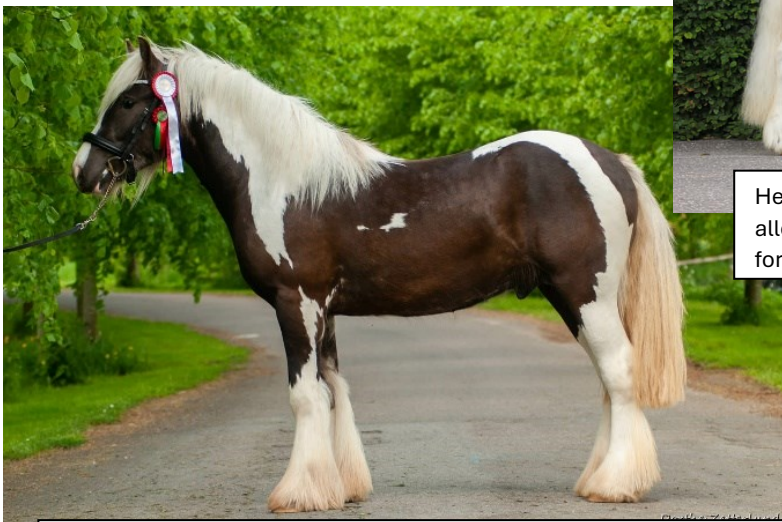
Her ses en lidt for lukket opstilling, bagbenene er for samlede, men hesten står flot på forbenene.