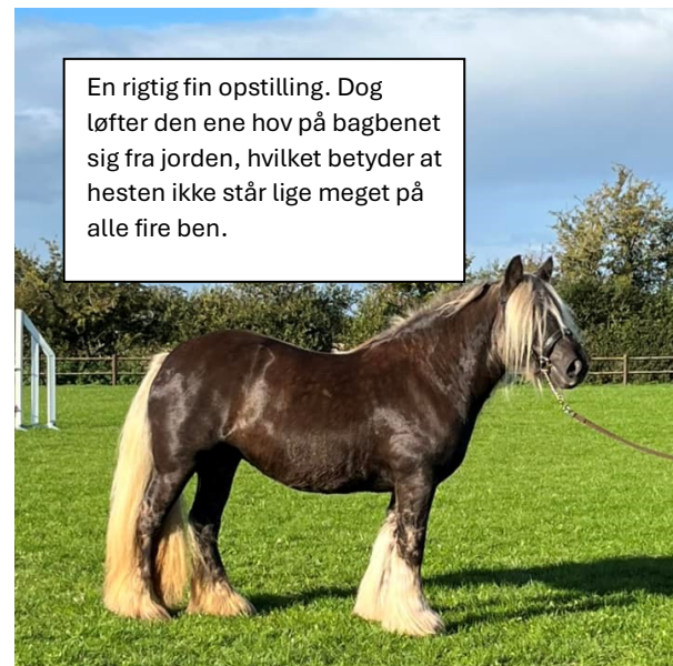
En rigtig fin opstilling. Dog løfter den ene hov på bagbenet sig fra jorden, hvilket betyder at hesten ikke står lige meget på alle fire ben.