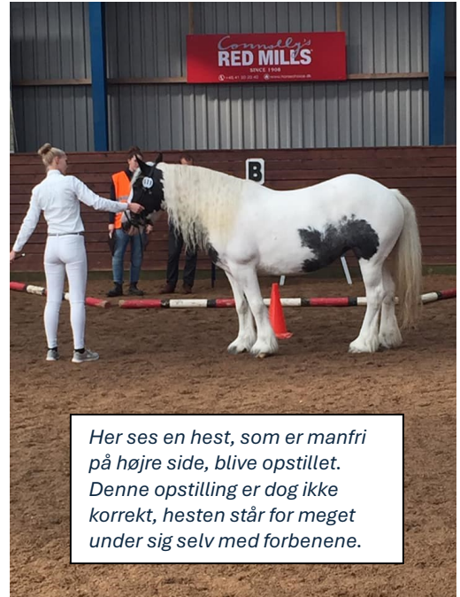
Her ses en hest, som er manfri på højre side, blive opstillet. Denne opstilling er dog ikke korrekt, hesten står for meget under sig selv med forbenene.